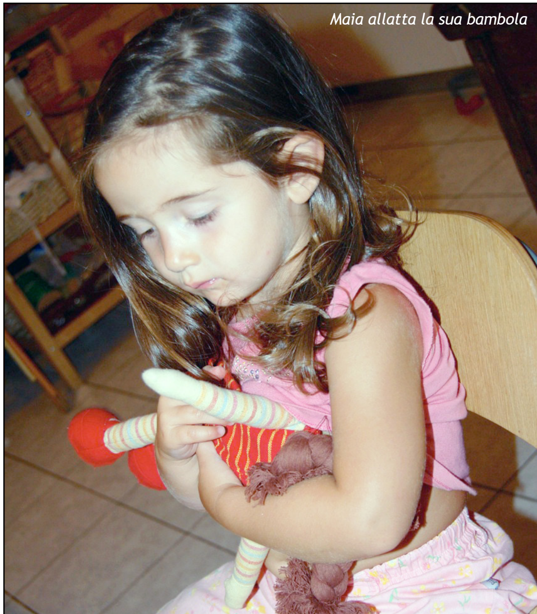
Maia allatta la sua bambola